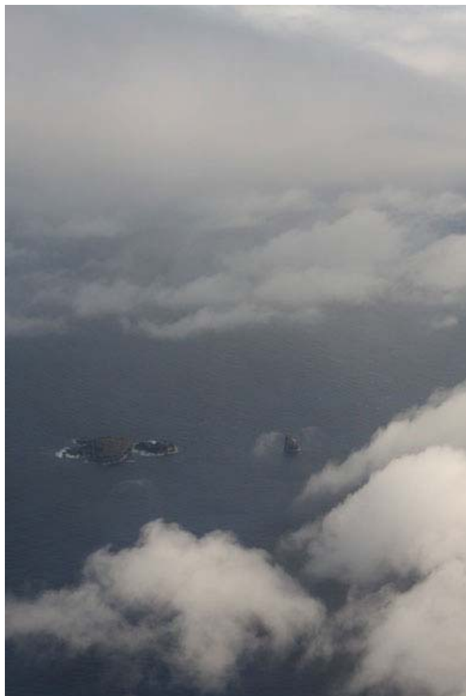
Motu Nui, Motu Iti y Motu Kau Kau vistos desde el aire.

Un bonito claro en el cielo sobre los tres islotes de isla de Pascua. En la reunión del avión decidimos también que en el momento del eclipse habrá un claro semejante entre nosotros y los astros.